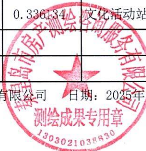
图: 王蕊, 审核: 郭丽丹 测绘单位: 秦皇岛市房产测绘咨询服务有限公司 日期: 2025年1